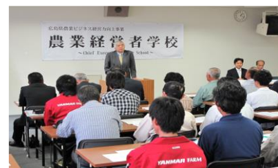
農業経営者学校研修