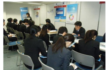
関西での合同就職説明会開催