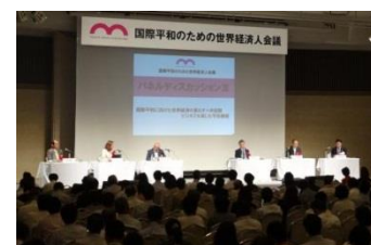
世界経済人会議の開催