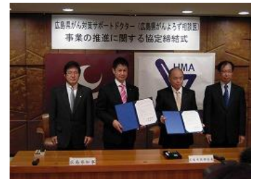
「がんよろず相談医」に関する医師会との協定締結