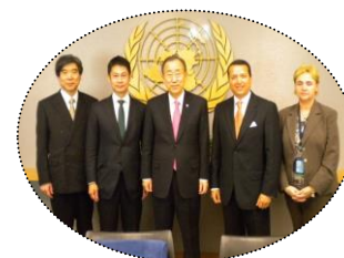
潘基文事務総長への協力要請