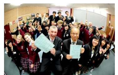
県立高等学校姉妹校締結