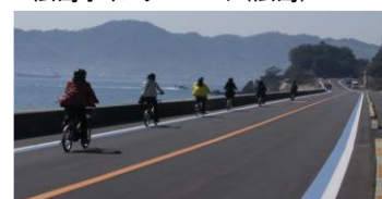
しまなみ海道サイクリング