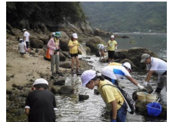
「山・海・島」体験活動