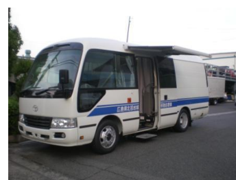
無医地区等への巡回診療