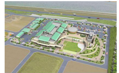
県立若草園 整備イメージ