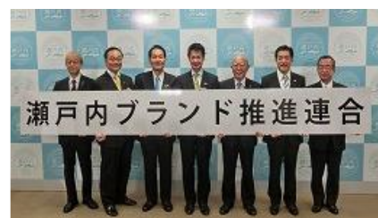
瀬戸内ブランド推進連合設立