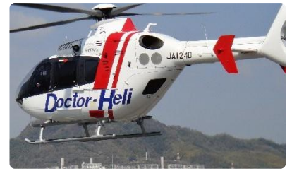
ドクターヘリの運航