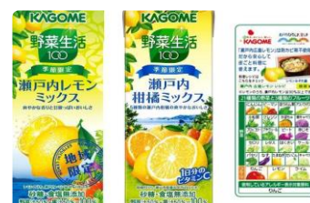
企業タイアップによる新商品開発