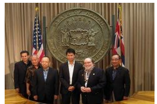
ハワイ州政府訪問