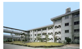
県立学校施設の耐震化