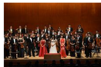
ワールド・ピース・コンサート開催