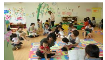
子育てサポートステーション設置