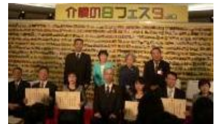
ケアマネマイスター広島の認証