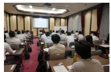
サテライトキャンパスひろしま開設