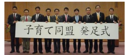
子育て支援知事による同盟