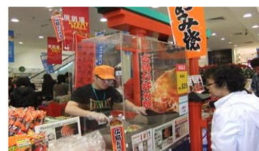
海外プロモーション実施(香港)