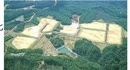
竹原工業・流通団地