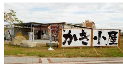
広島オイスターロード(広島)