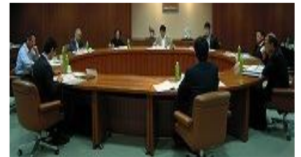
地域イノベーション戦略推進会議の開催